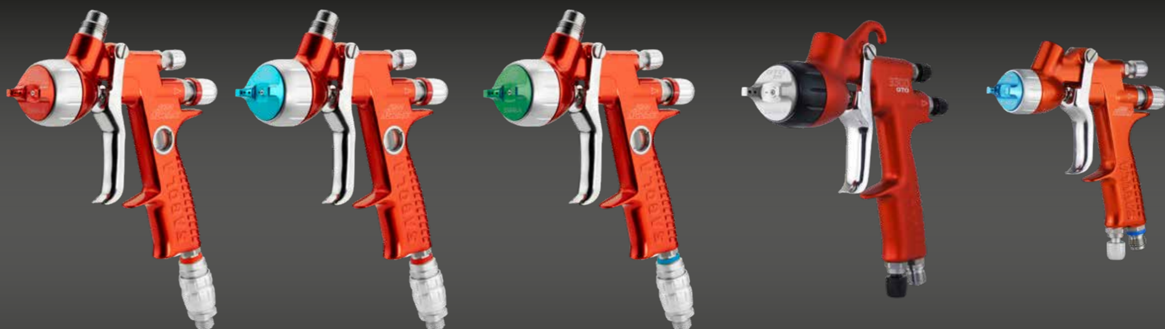
4600 Xtreme HS